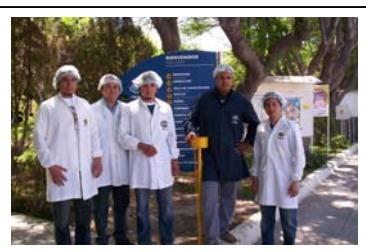
Docentes en Planta Frutos de Cuyo