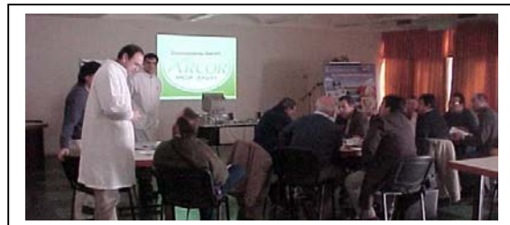
Taller con docentes en Villa Mercedes - 06