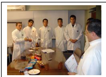
Pasantes en Bagley-Córdoba

De esta forma, los Referentes de RRHH contaron con los elementos necesarios para poder vincularse de forma directa con las escuelas de sus localidades.