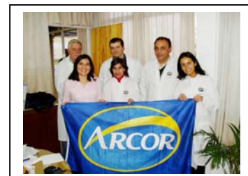
Docentes en Estirenos, San Luis