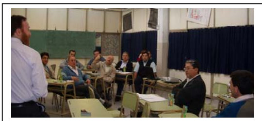
Taller con docentes en San Juan – 07

Dado el éxito de la actividad, en septiembre de 2007, fue Frutos de Cuyo, quien solicitó a la AEA el dictado de este mismo taller para docentes de la Escuela Técnica N° 1 de San Juan.