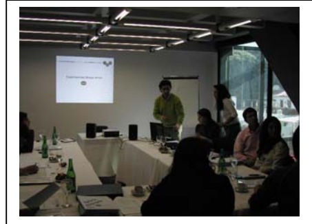
Jornada de trabajo con los RRHH de las plantas de La Campagnola